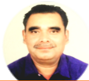
Director : MMTTC