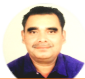
Director : MMTTC