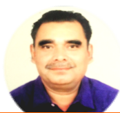
Director : MMTTC